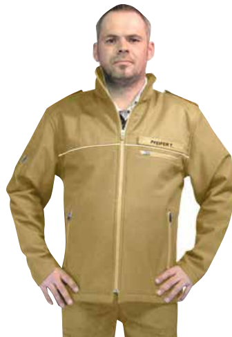
Optional mit Stick erhältlich